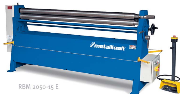
RBM 2050-15 E

Stabilní výkonná zakružovačka plechu se samostatně nastavitelnými válci a nožním ovládáním pro průmysl a řemeslné dílny. Pracovní šířka 2,05 m, tloušťka plechu max. 1,5 mm.