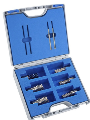
Sada jadrových vrtákov SILVER-LINE 25 + vrták BLUE-LINE

Objednací číslo 3873008 Cena bez DPH 140 Kč Cena s DPH 169 Kč